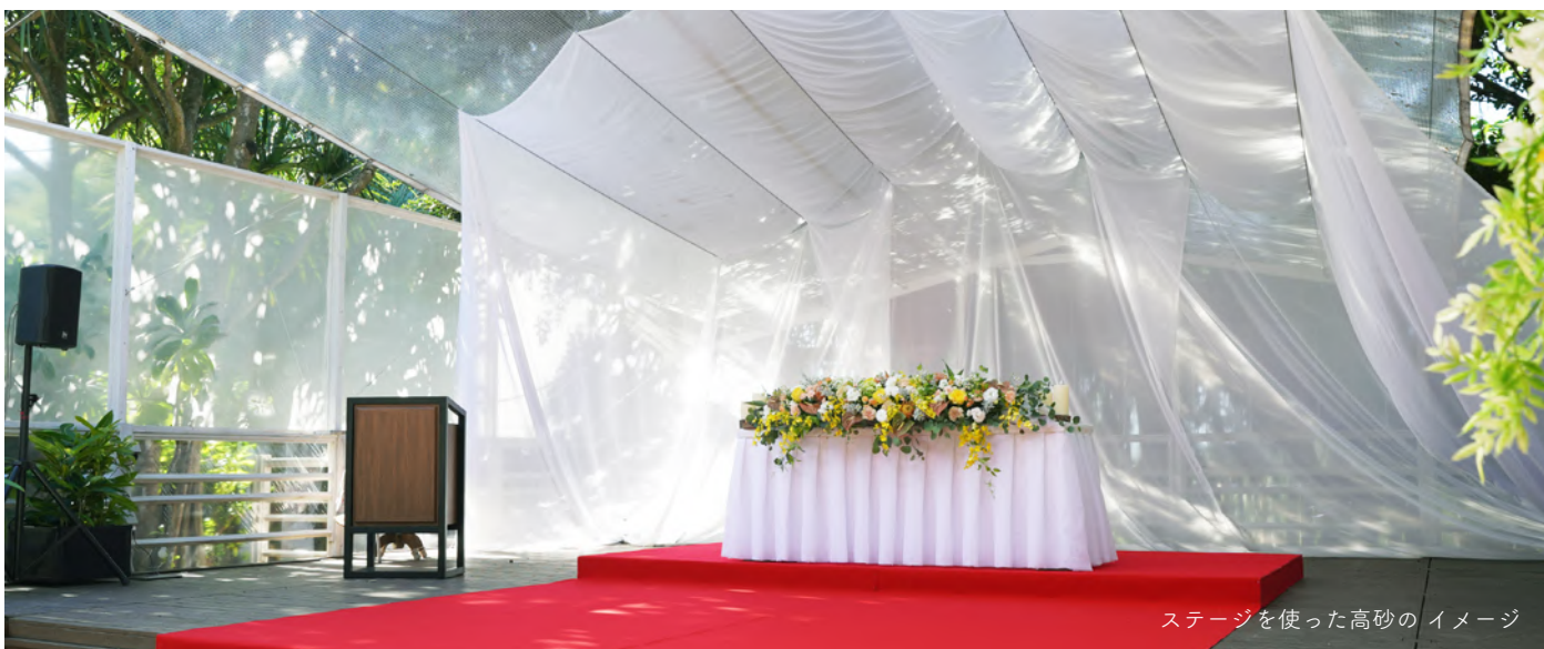
ステージを使った高砂のイメージ

“宿泊 × 温泉 × ビーチが隣接する環境”は、家族旅行を兼ねたウエディングを心地よく叶えます。